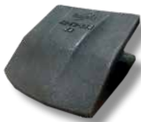
Huulilevyn suojapala 70mm