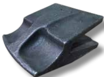
Huulilevyn suojapala 50-60mm