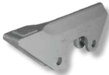
Reunan suojapala 35-40mm