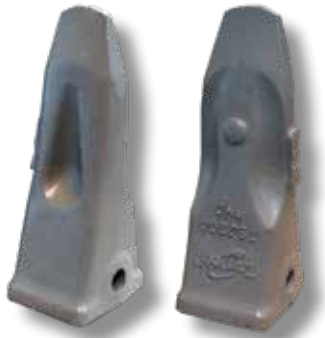
Kaivinkone (PHD, RC)