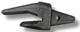
Istukka, haarukka (ULL)