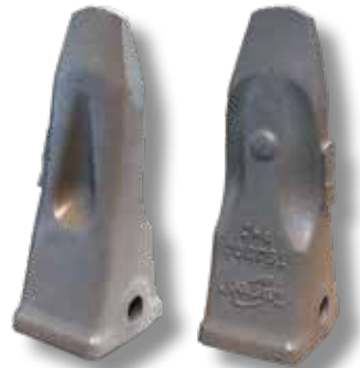
Kaivinkone (PHD, RC)