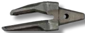
Istukka, haarukka (HD)