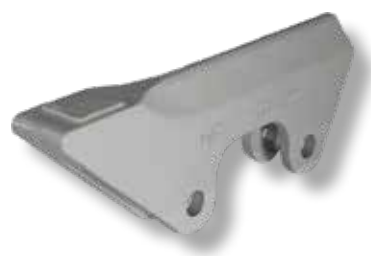
Reunan suojapala 35-40mm