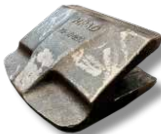
Huulilevyn suojapala 60-70mm