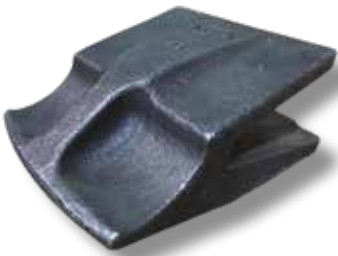
Huulilevyn suojapala 50-60mm