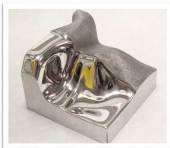
Pieza de Uddeholm AM Corrax® utilizada para ensayo de pulido

Alcanzando una dureza de 50 HRC era de esperar que su resistencia al desgaste abrasivo no fuera un inconveniente y, en efecto, gracias al ensayo de pin-on-disc verificamos que sus resultados eran los mismos que los del Corrax convencional. Pero los resultados sorprendentes llegaron al estudiar su aptitud para pulido: Uddeholm AM Corrax® iguala los resultados de aceros convencionales similares, alcanzando mejores resultados que otros. Para asegurar el traslado de sus propiedades a la aplicación, estuvimos realizando diversos ensayos en una pieza hecha especialmente para pulir con todos los distintos tipos de superficies que puede haber en una herramienta, permitiéndonos realizar ensayos más realistas. Adicionalmente, hemos producido piezas con diferentes tipos de impresoras y Uddeholm AM Corrax® siempre ha mostrado buenos resultados, alcanzando el nivel A1 de pulido, necesario para la mayoría de aplicaciones de moldes de inyección de plástico.